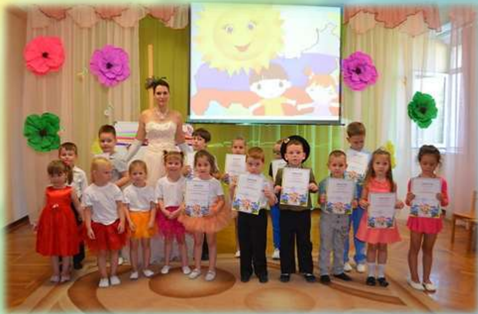
СОЗДАНИЕ ВЫСТАВОК, УЧАСТИЕ В КОНКУРСАХ