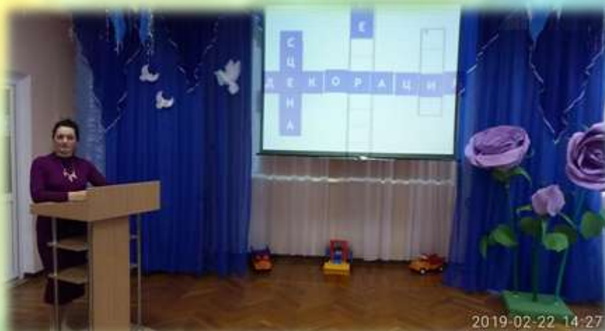
ПРЕЗЕНТАЦИИ, МАСТЕР-КЛАССЫ, РАЗВЛЕЧЕНИЯ