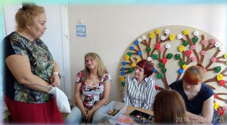
ДНИ ОТКРЫТЫХ ДВЕРЕЙ